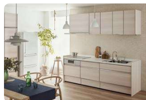
C システムキッチン交換